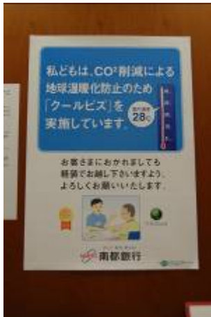
クールビズを呼びかけるポスター