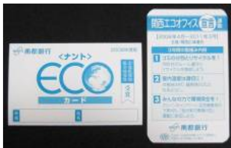
行員全員に配布される南都銀行の「エコカード」